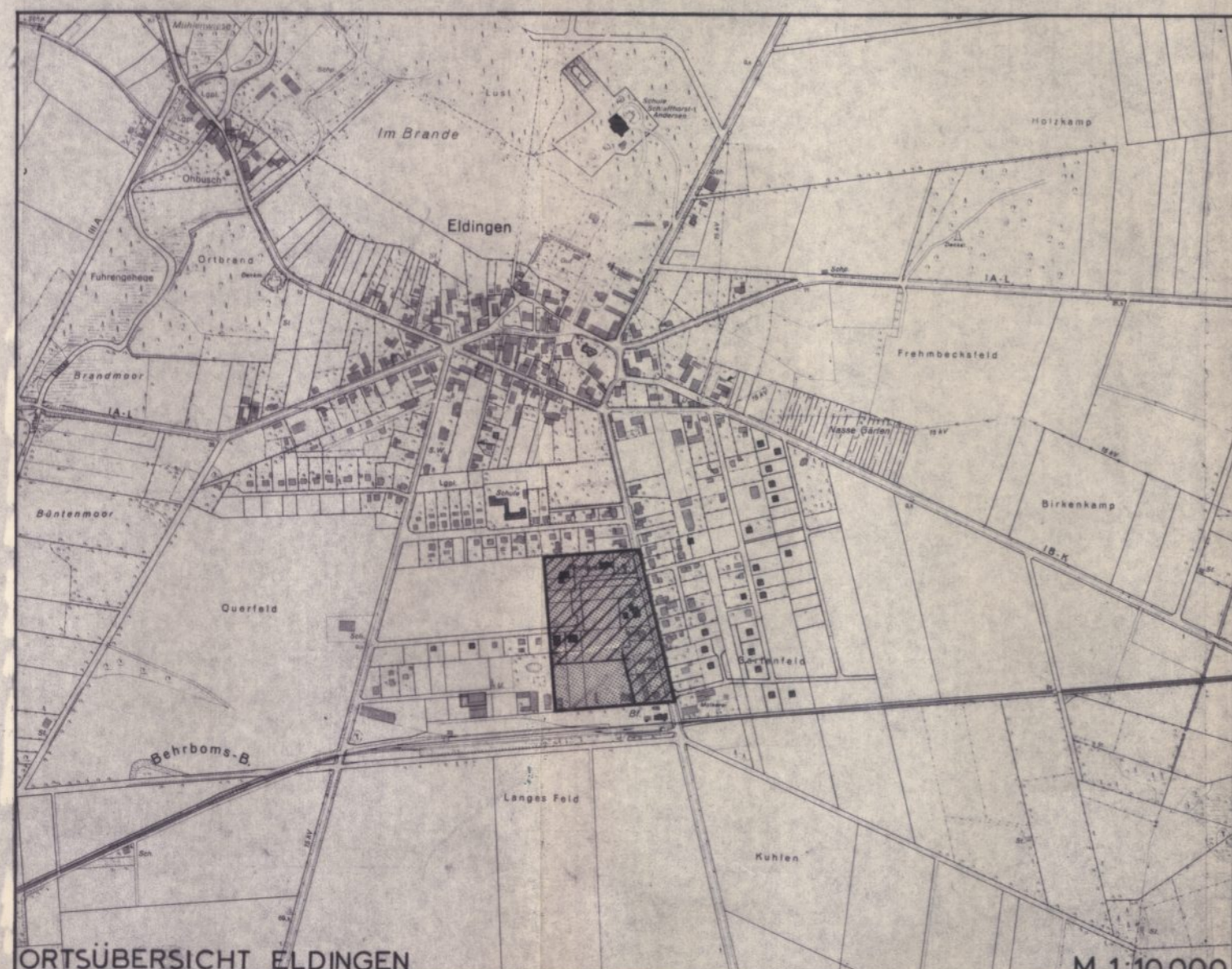
ORTSÜBERSICHT ELDINGEN GELTUNGSBEREICH DES B-PLANS „AM SPORTPLATZ“

Nach § 91 Niedersächsische Bauordnung (NBauO) handelt ordnungswidrig, wer als verantwortliche Person im Sinne der §§ 57 - 60 der NBauO vorsätzlich die Ausführung von Baumaßnahmen - auch wenn sie gemäß § 69 NBauO bzw. Anhang zu § 69 NBauO keine Baugenehmigung bedürfen - entgegen den Vorschriften der §§ 2 und 3 dieser Satzung veranlaßt oder durchführt. Ordnungswidrigkeiten können mit einer Geldbuße bis zu DM 10.000,00 geahndet werden.